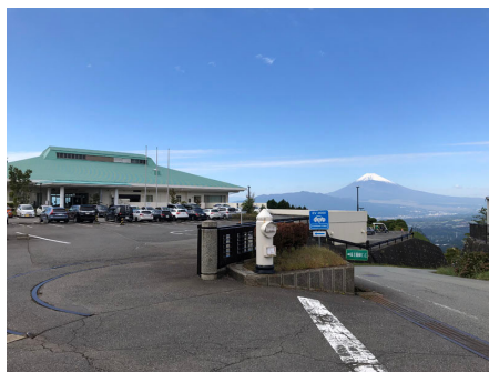
別荘地近くの富士箱根カントリークラブ