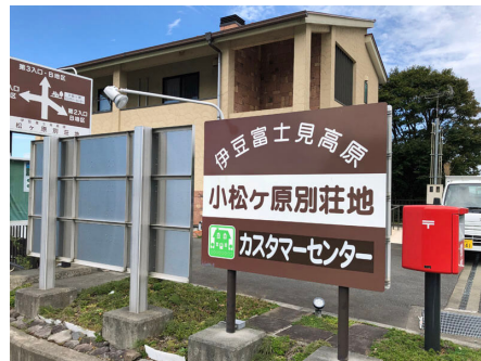
カスタマーセンター入り口