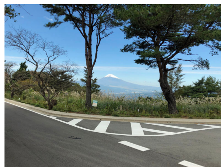
別荘地から富士山を望む