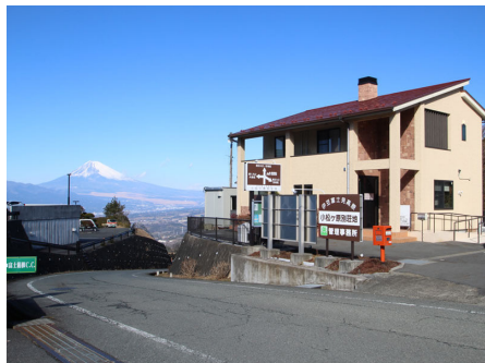
カスタマーセンター

裾野を長く引く霊峰富士を一望し、駿河湾・三島・沼津の町を眼下に見る小松ヶ原別荘地は、富士・箱根・伊豆国立公園のほぼ中央に位置するなだらかな標高550メートルの高原です。周囲は伊豆スカイラインなどのハイウェイが走り、伊豆・箱根を全てあなたのものにできる最高の立地。富士山一帯の街並みの眺望は絶景です。すぐ隣には富士箱根CCがあり、ゴルフ好きの方にはたまらない別荘地です。