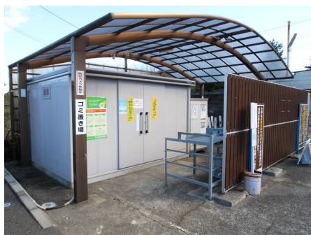
ゴミ置き場（カスタマーセンター横）