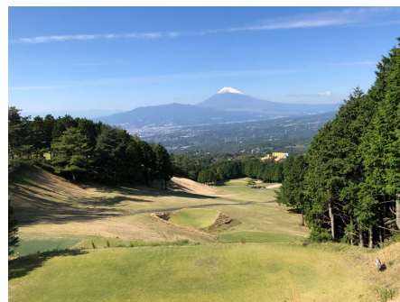
別荘地近くの富士箱根カントリークラブ