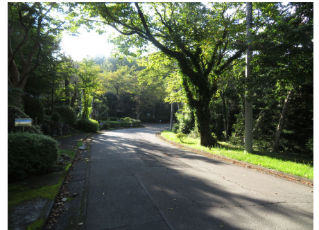
整備された別荘地内