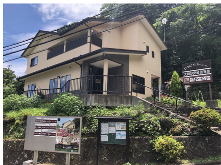
カスタマーセンター

リゾート地としての長い歴史を持つ、伊豆半島。大自然と穏やかな気候、そして何よりも数多くの良質の温泉が人々を魅了してきました。その伊豆の最高峰、天城山と遠笠山の山裾に位置する熟成された伊豆大川汐見崎。眼下には、広大な相模灘が広がり、伊豆大島をはじめとする島々が彩りを添えています。四季折々の景観と、味覚の変化を楽しみながら、充実したリゾートライフをお過ごし頂けます。