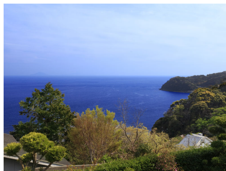
別荘地内より眺望