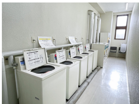
コインランドリー