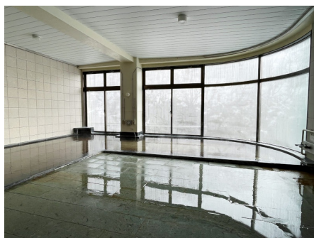
日が差し込む温泉大浴場