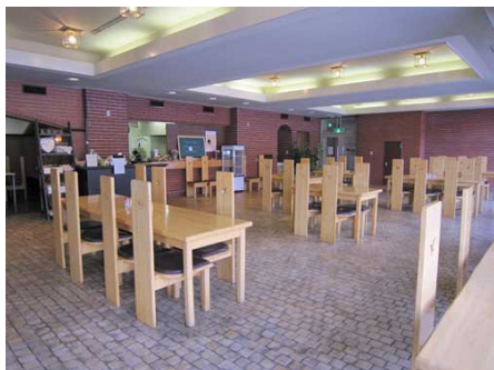
レストラン「ソレイユ」