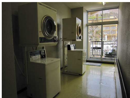
コインランドリー