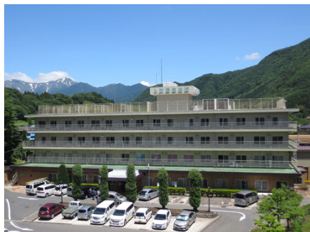
隣接した温泉病院