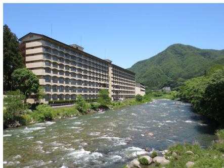
マンションの真横には利根川が流れる