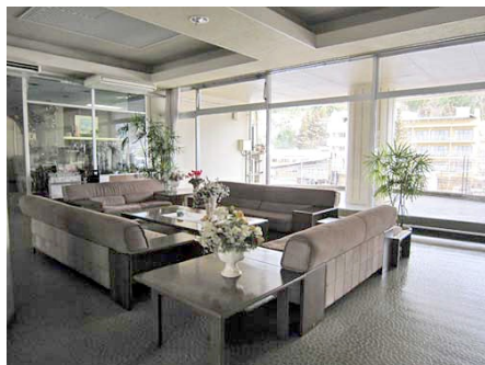
日が差し込むラウンジ