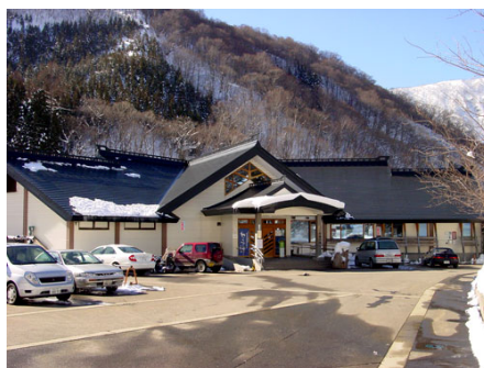
車で約15分の温泉施設「宿場の湯」