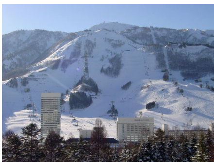
シャトルバスが出る苗場スキー場