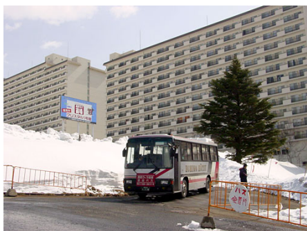
苗場スキー場シャトルバス運行