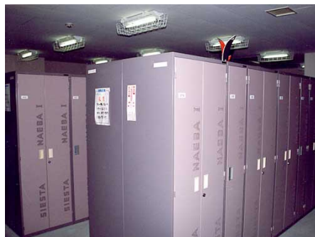
スキーロッカー室