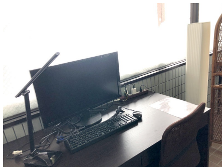
テレワークスペース