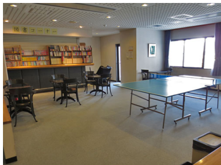
卓球台と図書コーナー