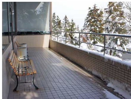
中庭と喫煙スペース