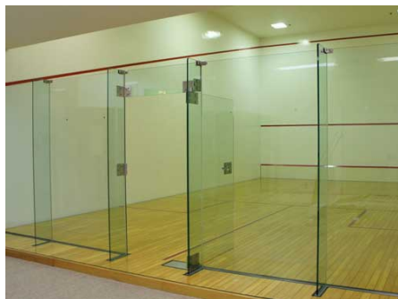
スカッシュコート