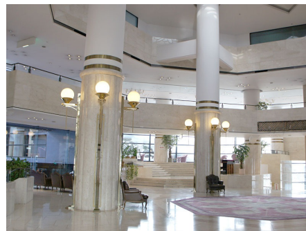
アトリウムロビー