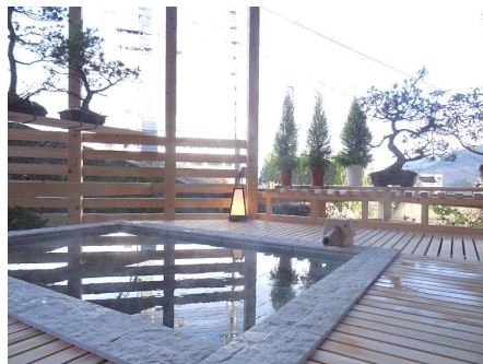
2020年新設の露天風呂