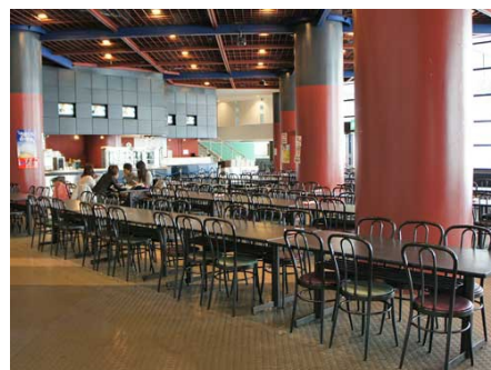
ゲレンデ隣接レストラン