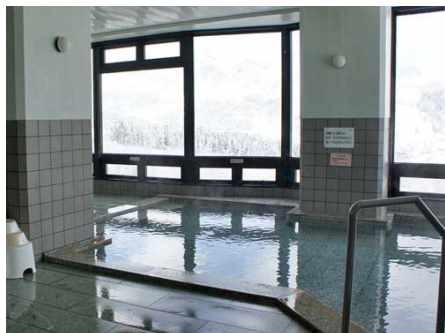
24時間営業の温泉大浴場