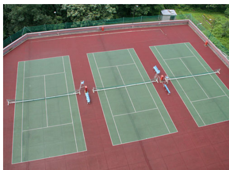
テニスコート（休止中）