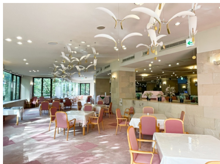
レストラン（通年営業）