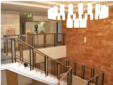
エントランスからフロントに通じる階段