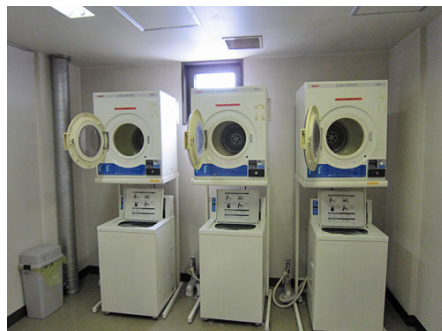
コインランドリー