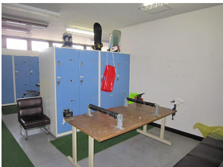
スキーロッカー (チューンナップコーナー付)