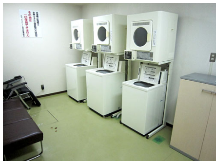
コインランドリー