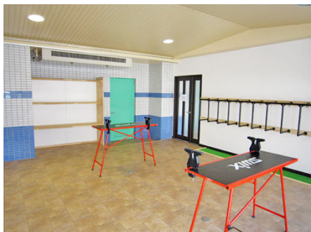
チェーンナップルーム