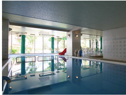
屋内10mプール (子供用もあり)