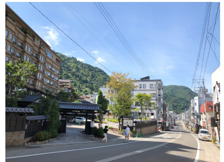
湯沢温泉街目の前の立地