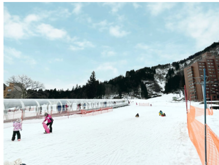
一本杉スキー場に隣接