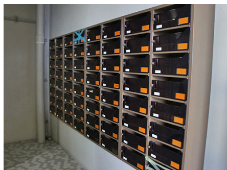
各部屋専用メールボックス