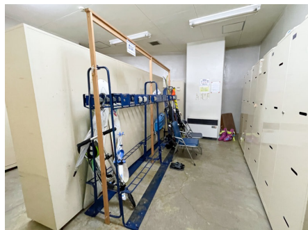
スキーロッカー (先着順貸出し/無料)