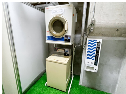
コインランドリー (地下2F)