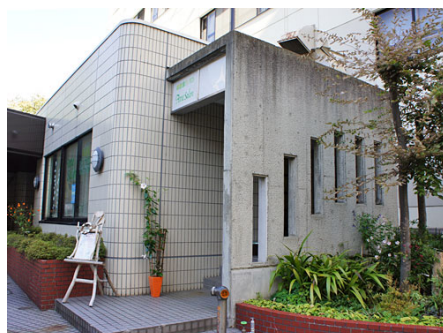
1Fは美容室「アン サロン」 (マンション別経営)