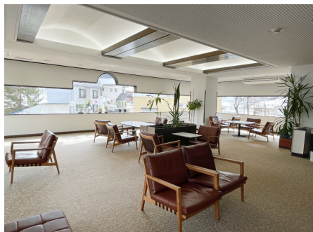
採光豊かなラウンジ