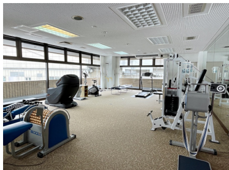
スポーツルーム（マッサージ機あり）