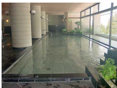
温泉大浴場（隣接ホテル内）