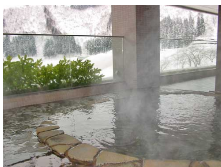
露天風呂（隣接ホテル内）