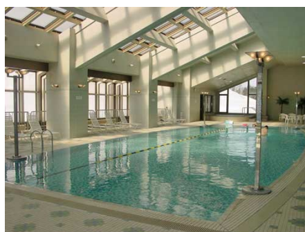
室内温水プール（隣接ホテル内）