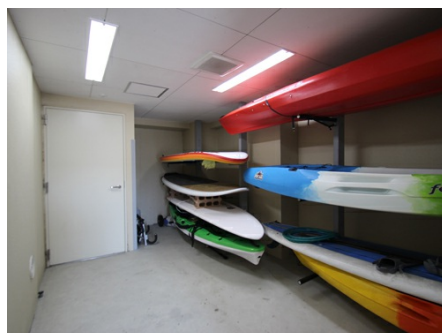
ペット用シャワー室