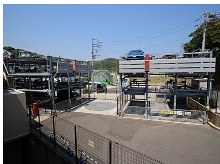
ロングボード等置場