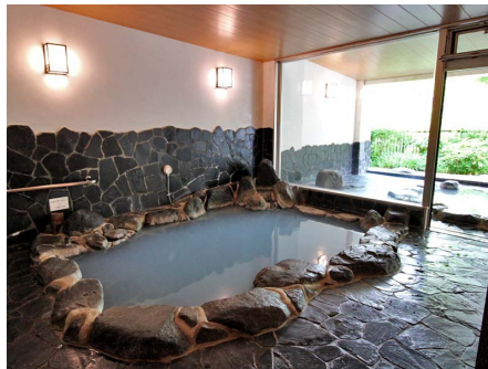
温泉大浴場（岩風呂）