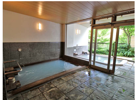
温泉大浴場（檜風呂）