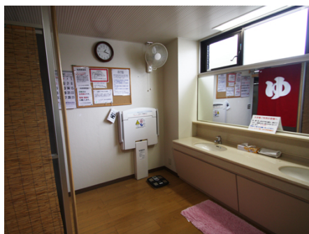
ベビー台付きの女性用脱衣所