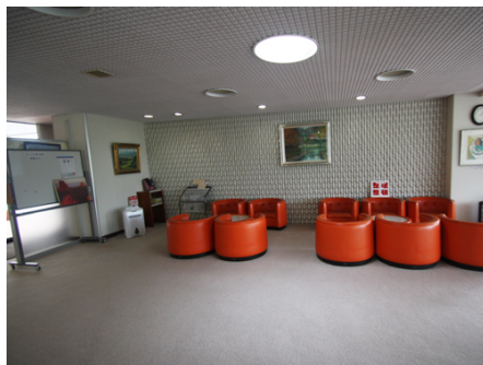
ラウンジスペース