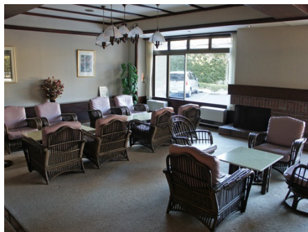
暖炉のあるロビー