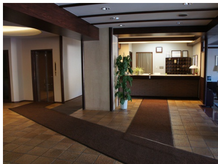
エントランスと管理室