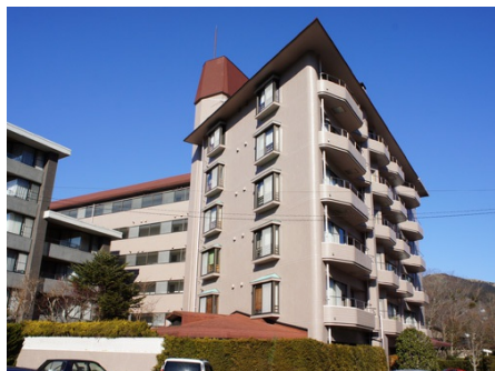
ジェントル仙石原 外観