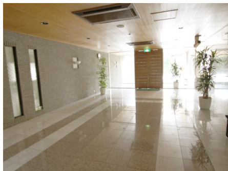
高級感あふれるエントランス