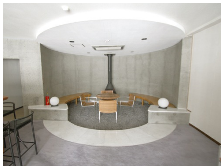
バーカウンター横