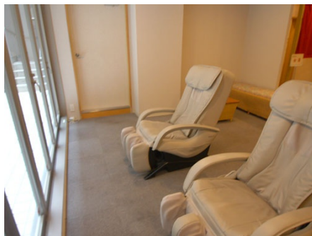
マッサージチェア