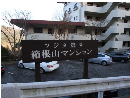
フジタ第9 箱根山マンション