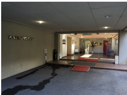
マンション入り口