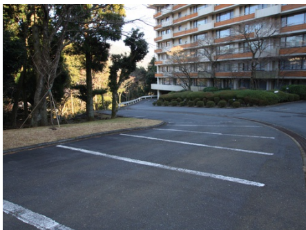
無料で使える駐車場