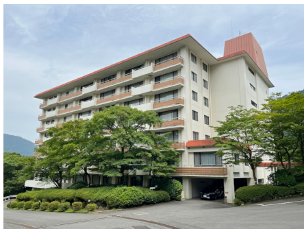
マンション外観 (フジタ第8)