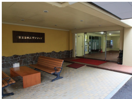
マンション入り口