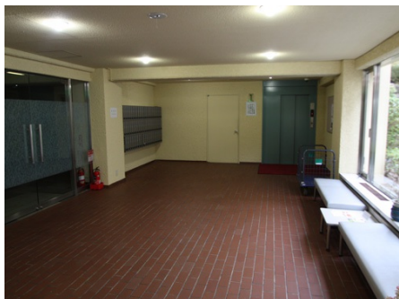
エントランスロビー