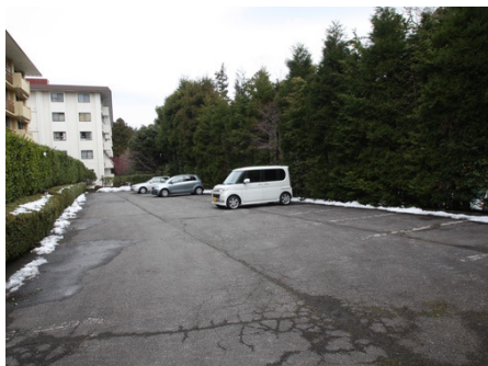
無料で使える屋外駐車場