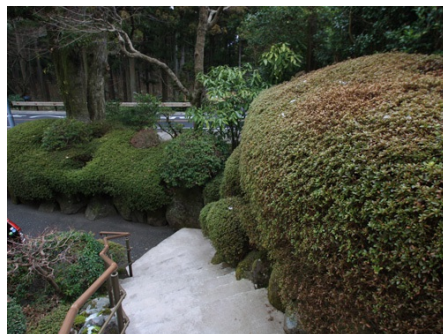
手入れの行き届いた庭木