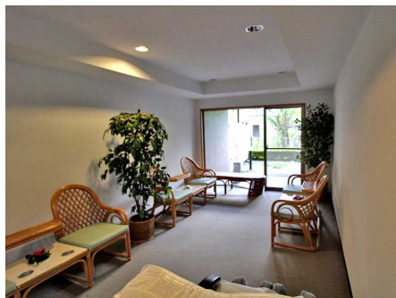
湯上がりラウンジ