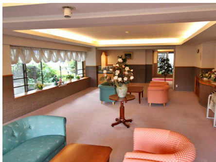
エントランスロビー