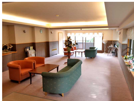
エントランスロビー