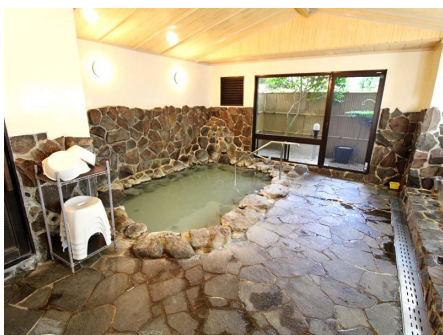
温泉大浴場（和風呂）