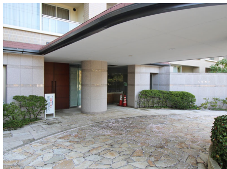
マンション入口の車寄せ