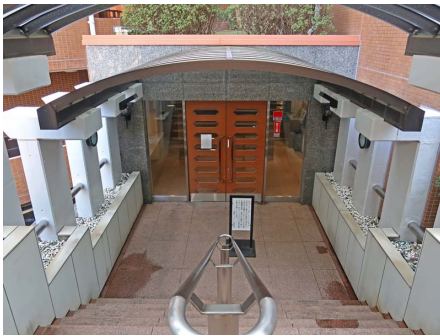
入口部分までは階段となっております