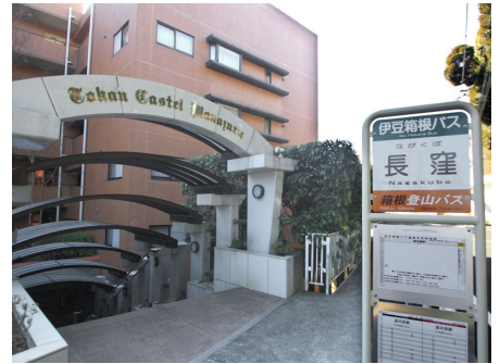
マンション入口(目の前にはバス停)