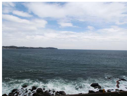
駐車場からの眺め