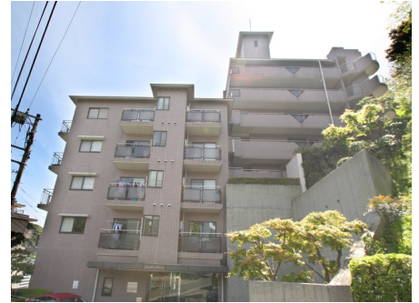
マンション入口側外観