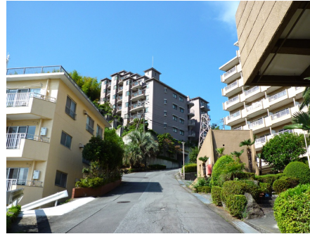
マンションまでの道