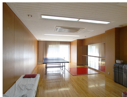
アスレチックルーム