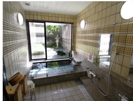
大浴場（温泉ではありません）