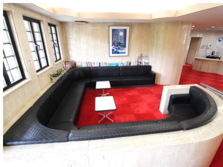
エントランスラウンジ