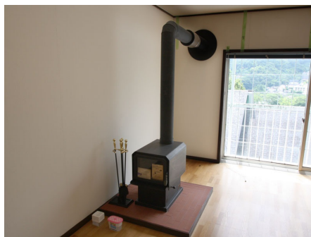
山小屋風のスタンスでペーチカ付