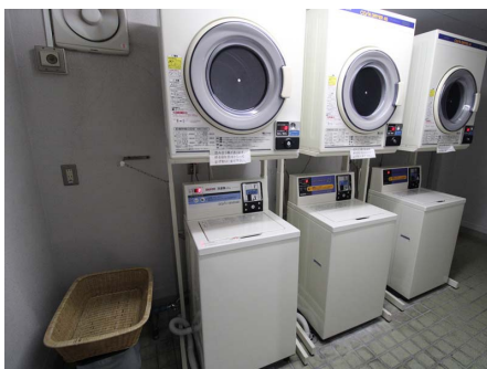
ランドリールーム