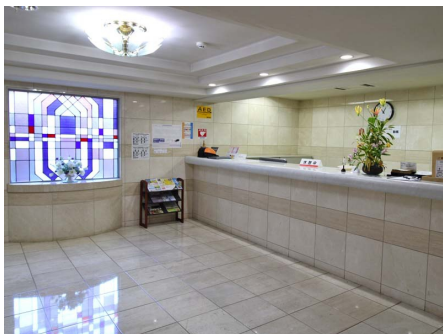
大理石張りの清潔感のあるロビー