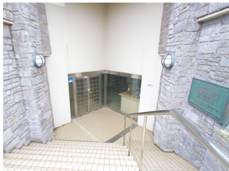
エントランスの階段とスロープ