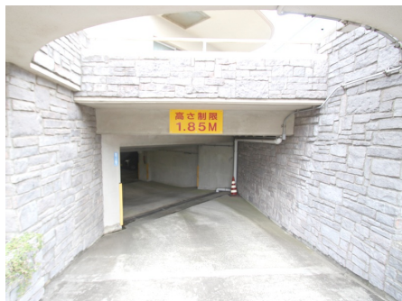
地下駐車場入り口