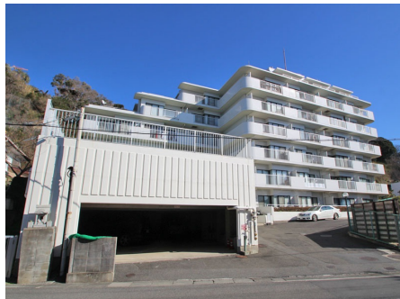
屋内駐車場と外観