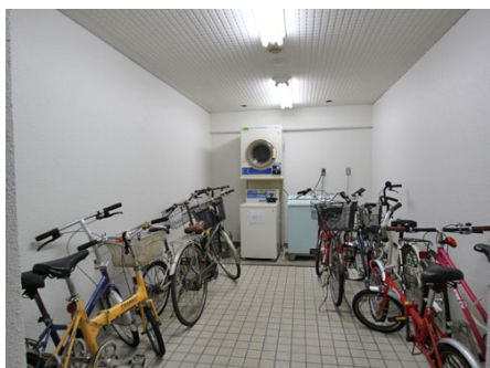
駐輪場兼ランドリールーム