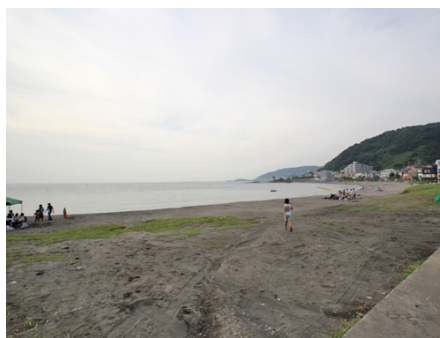
目の前の秋谷海岸