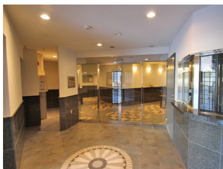
エントランス内部