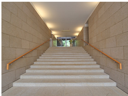
エントランスの階段