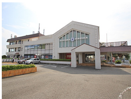
葉山マリーナが目の前