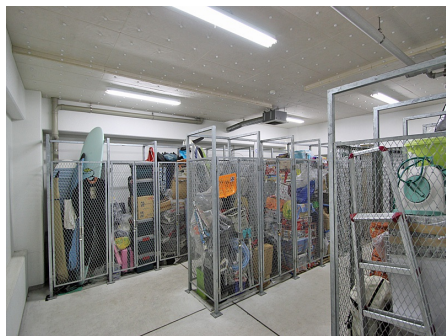
トランクスペース