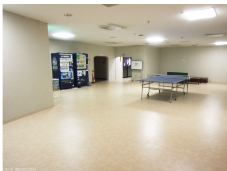
大浴場前の卓球台と自動販売機