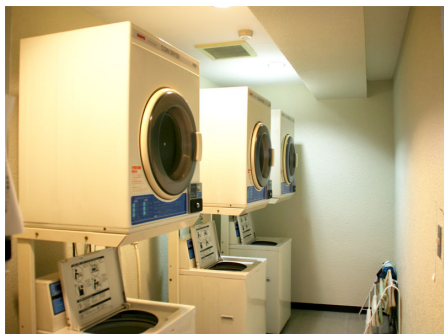
コインランドリー