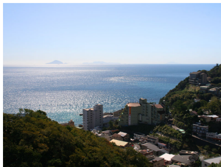
マンションからの眺望