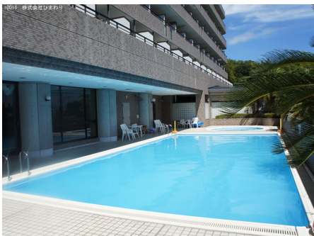
クアプール(夏季のみ)