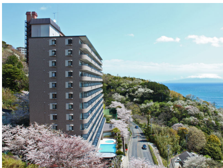
国道から見る外観