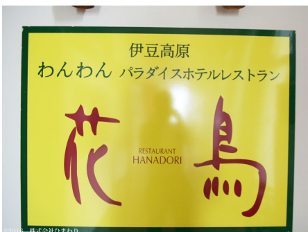
レストランはペット可