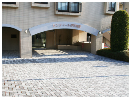
マンション入り口