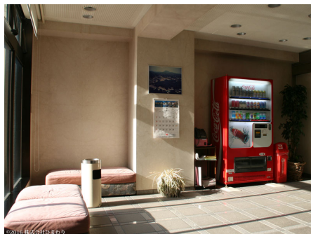
エントランスホール