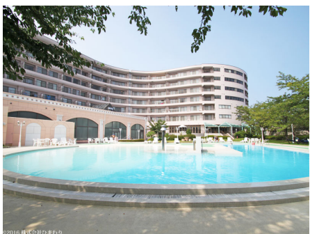
プールからのザグラン伊豆高原