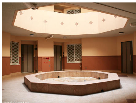
マンション中央の吹き抜け