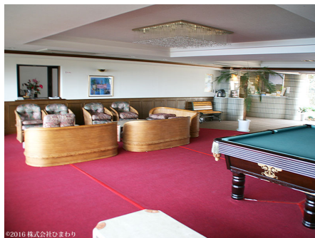
ホテル並みのエントランスロビー